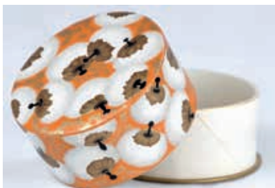
Boîte à poudre, Maison Coty, XX e siècle, Musée du Cartonnage et de l'Imprimerie, inv. 2003.14.688

Ce musée unique en France retrace l'histoire des modes de fabrication et d'impression de la boîte en carton du milieu du XIX e siècle à nos jours. Il présente des objets nés des deux industries fondatrices de l'activité à Valréas - le cartonnage et l'imprimerie- qui devint, à la fin du XIX e siècle, le plus grand centre de cartonnage français . Les collections du musée, liées au patrimoine industriel, rassemblent matériels, boîtes en carton, étiquettes lithographiques ainsi que de nombreux documents iconographiques. Reflets des évolutions techniques, économiques et sociales, elles confirment la richesse des productions dans les domaines de la