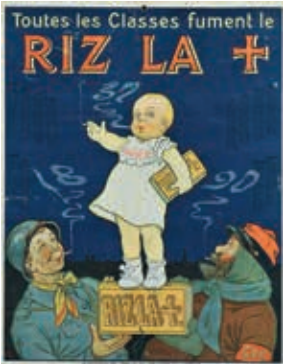
Ogé, Eugène. Affiche Riz la [Croix], 1917 Ville de Paris – Bibliothèque Forney

La petite fille du chocolat Me-nier, les élèves gourmands de LU, le bébé Cadum... Ces publicités enfantines ont accompagné plusieurs générations. Ancrées dans l’imaginaire collectif, elles sont emblématiques de la société de consommation. Si les premières réclames datent des années 1830, la révolution visuelle s’opère à la fin du XIX e siècle avec les nouvelles techniques de reproduction. Les illustrations d’enfants sont rapidement utilisées pour les publicités, qui véhiculent des images stéréotypées , que ce soit le bébé