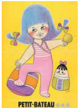
Busillet, Affiche Petit bateau, vers 1970 / Ville de Toulouse – Musées Paul-Dupuy et Georges-Labit

L’exposition retranscrit, à travers une série d’images, d’objets décoratifs et d’illustrations antérieurs aux années 1990 , l’univers coloré et éclectique de la publicité, tout en s’interrogeant sur les représentations de l’enfant et ses enjeux. Elle propose une scénographie ludique et foisonnante qui témoigne de la surabondance passée et actuelle des messages publicitaires. Enfin, une attention particulière est portée au jeune public avec un parcours famille, un espace jeux au centre de l’exposition et une mallette pédagogique pour les scolaires.