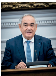
Maurice Chabert, Président du Conseil départemental de Vaucluse

L a solidarité envers nos concitoyens les plus fragiles constitue l'une de nos compétences essentielles et plus encore : une préoccupation quotidienne pour les élus et les agents du Conseil départemental.