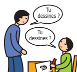
Utilise le langage de façon écholalique