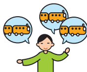
Parle de façon incessante sur un sujet particulier