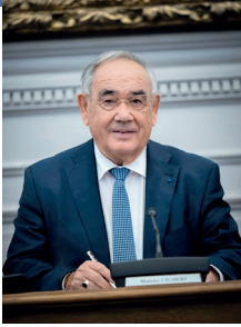
Maurice Chabert, Président du Conseil départemental de Vaucluse

L a solidarité envers nos concitoyens les plus fragiles constitue l'une de nos compétences essentielles et plus encore : une préoccupation quotidienne pour les élus et les agents du Conseil départemental.