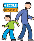
N'apprécie pas les changements