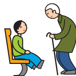
Comprend mal les conventions et les règles sociales