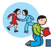
Ne joue pas avec les autres enfants