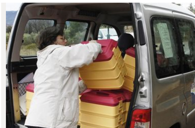
Tout savoir sur l'Allocation Personnalisée d'Autonomie (APA)