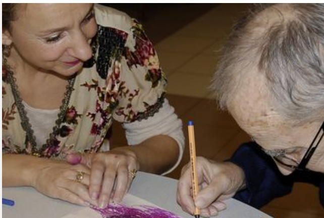
Les alternatives au maintien à domicile