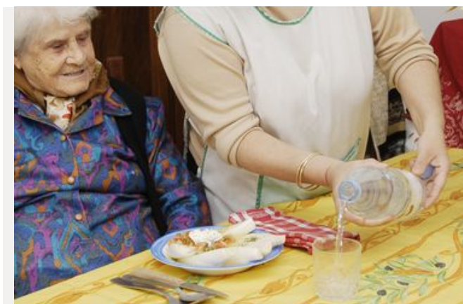
Les aides sociales à domicile