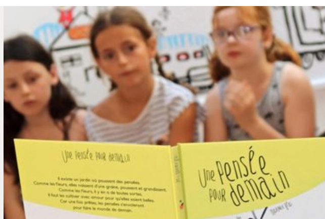
Le Service Livre et Lecture