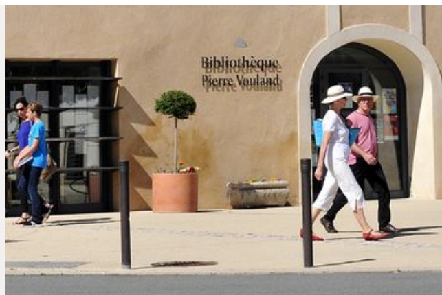
Le Schéma départemental de développement de la lecture 2018-2020

Le Conseil départemental s'engage sur de nouveaux enjeux de développement pour lesquels la lecture et le livre sont centraux.