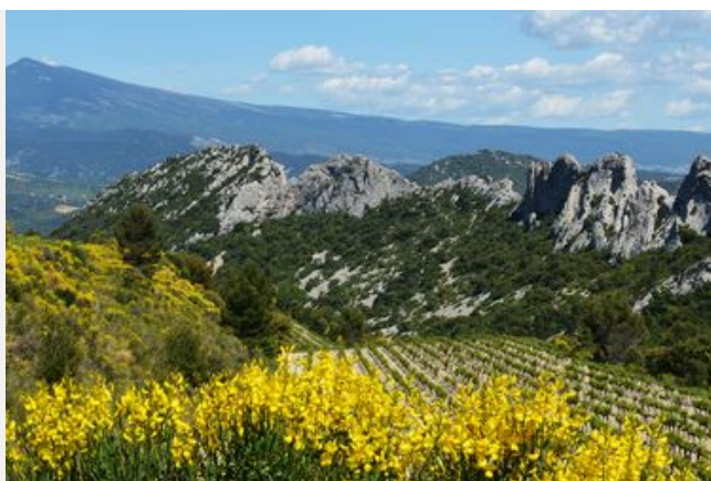
Les maisons de Service au Public (MSAP)