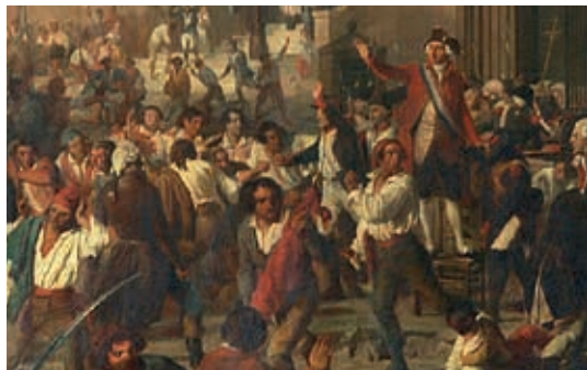
Jules Varnier, Rodolphe d'Aymard et la garde nationale d'Orange arrêtant les massacres d'Avignon, le 11 juin 1790, huile sur toile, 1845 / © Hôtel de ville d'Orange