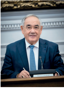
Maurice Chabert, Président du Conseil départemental de Vaucluse

L a solidarité envers nos concitoyens les plus fragiles constitue l'une de nos compétences essentielles et plus encore : une préoccupation quotidienne pour les élus et les agents du Conseil départemental.