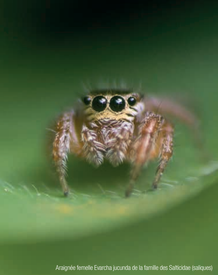
Araignée femelle Evarcha jucunda de la famille des Salticidae (saliques)