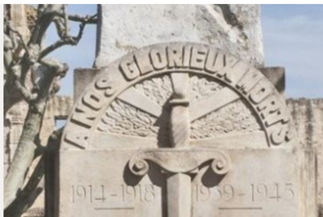
Monuments aux morts