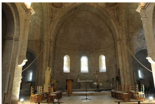
Église Abbatiale Notre-Dame de Senanque