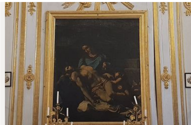
La Pieta, Huile sur toile