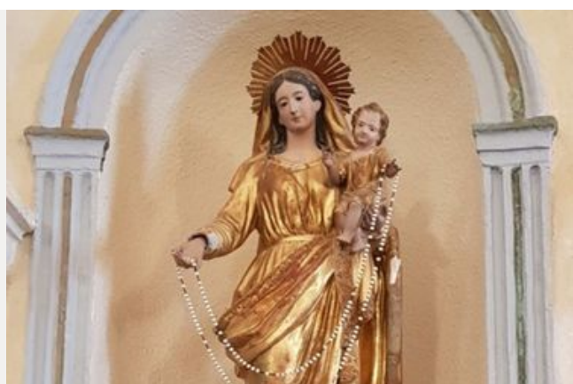
La Vierge à l'enfant