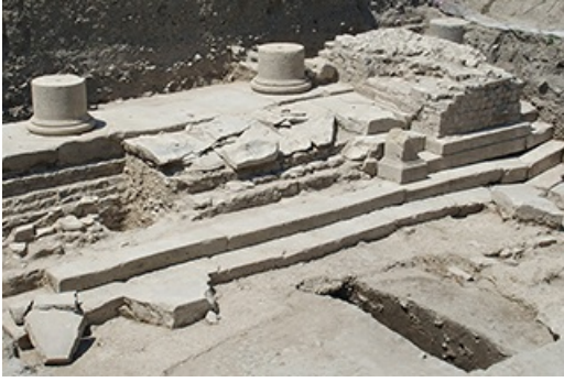
Forum, Vaison-la-Romaine