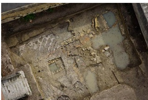
Orange, avenue des thermes

Les archéologues fouillent, découvrent, documentent, étudient, publient, exposent et expliquent... Créé en 1983, le service départemental d'archéologie est agréé par l'Etat depuis 2006 pour réaliser des diagnostics et des fouilles préventives portant sur les périodes antique et médiévale à l'occasion des travaux de construction, d'urbanisme et d'aménagement du territoire.