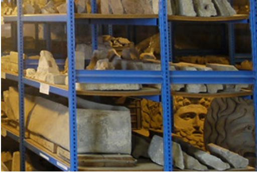
Dépôt musée archéologique, Orange