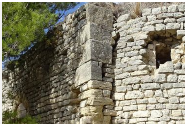
Des sondages d'évaluation dans un castrum du XIIe siècle