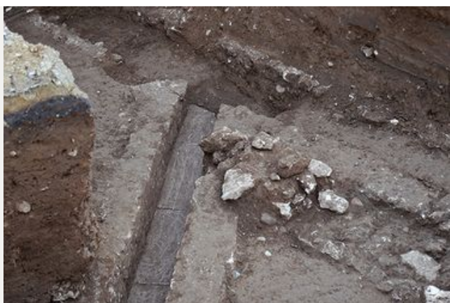
Occupation du sol et aménagements architecturaux d'époque gallo-romaine à Cavillon