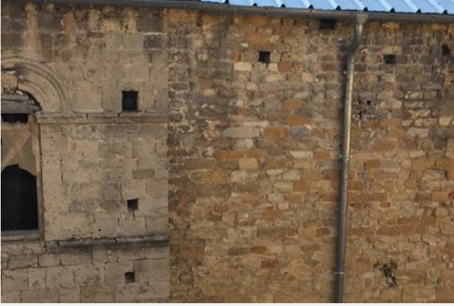
Une étude archéologique au sein de l'Ilot dit de l'ancien Hôtel de Ville d'Orange