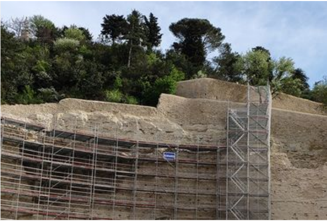
Restauration de l'Hémicycle d'Orange