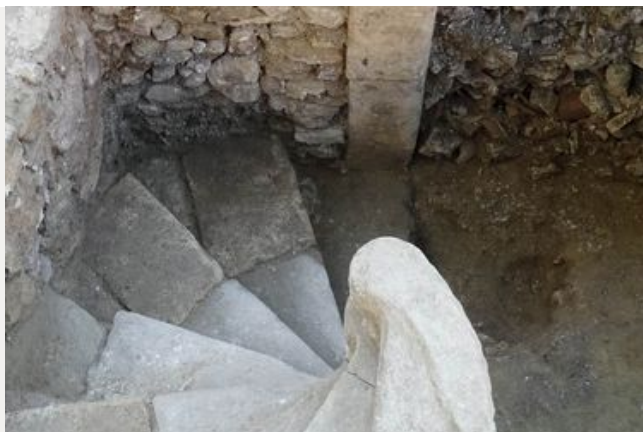
La découverte d'un bain juif à Pernes-les-Fontaines