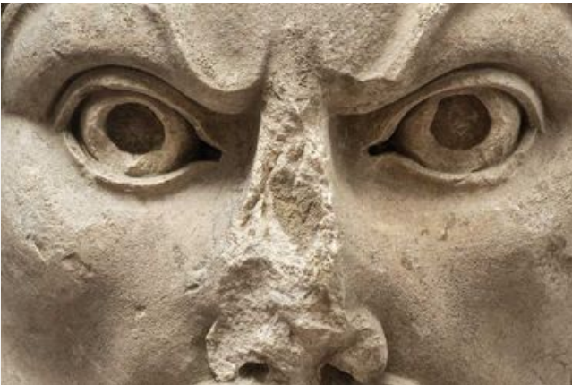
Le masque acrotère d'Hercule découvert à Orange, Fourches-Vieilles