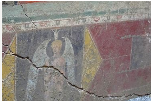
Une découverte exceptionnelle à Avignon

Les récentes fouilles dans le cadre de rénovation ou d'intervention pour la réalisation d'un diagnostic archéologique ont permis de connaître un peu plus l'histoire de notre territoire.