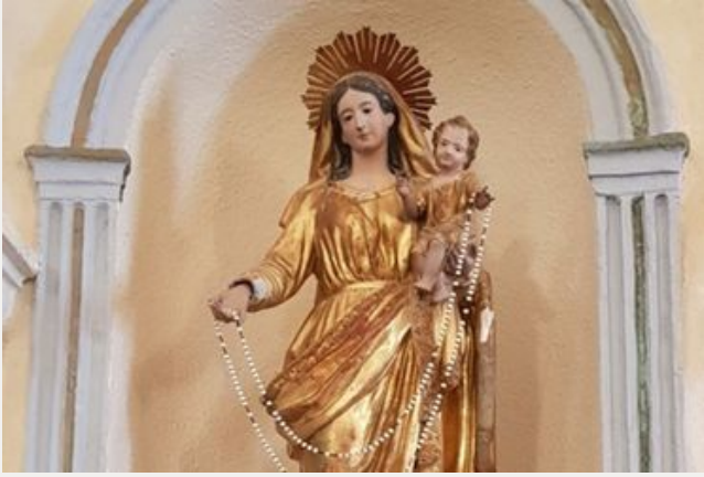
La Vierge à l'enfant