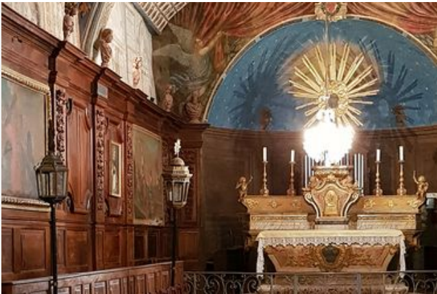
Chapelle des Pénitents blancs