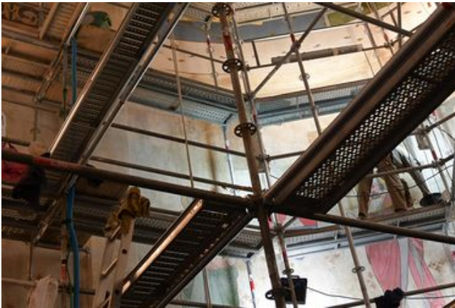
Peintures Murales, Chapelle de la Vierge et Chapelle Saint-Joseph