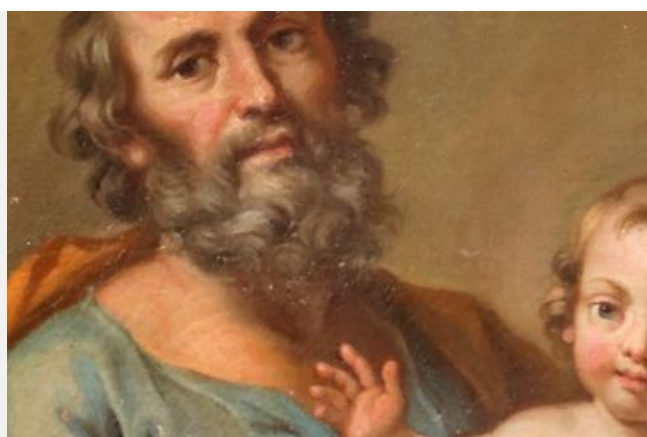
Saint-Joseph et l'enfant Jesus