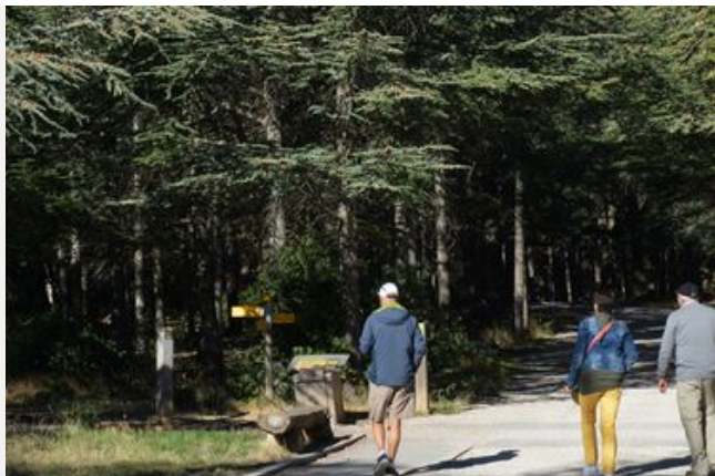
La forêt des cèdres du petit Luberon