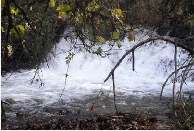
La forêt départementale de Sivergues