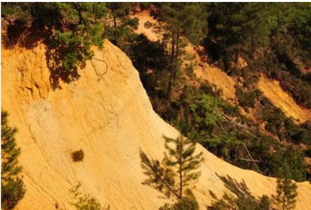
La colline de la Bruyère