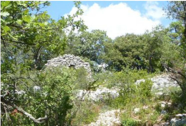
La forêt de la Pérégrine et le Ravin du Défend