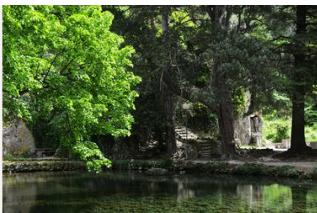
La forêt départementale du Groseau