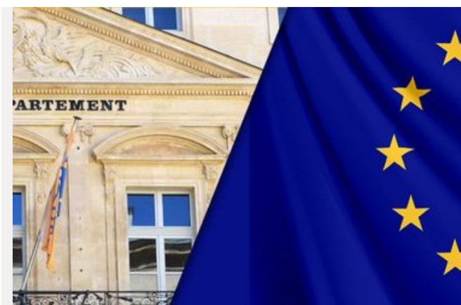
Accompagnement des publics les plus éloignés de l'emploi

Afin de favoriser les synergies entre le FSE et l'intervention départementale en matière d'insertion, les priorités du présent PDI s'inscrivent pleinement dans les orientations de l'axe 3 du PON FSE "lutter contre la pauvreté et promouvoir l'inclusion".