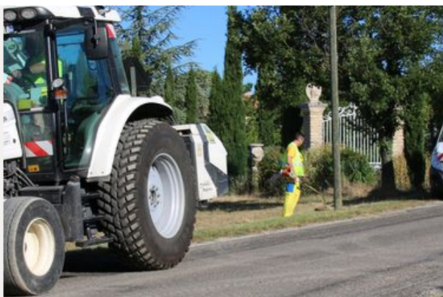
Un réseau routier dense à entretenir à sécuriser