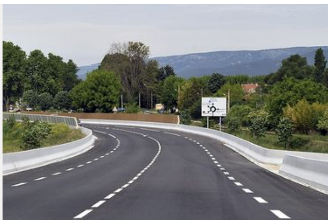
Règlement de voirie départemental