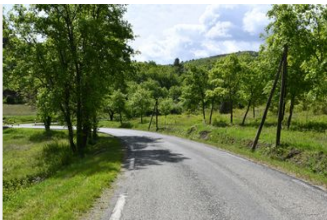
Le réseau routier départemental

De par sa situation géographique, le Vaucluse est l'un des départements français où le trafic routier est le plus élevé. L'objectif du Département est d'avoir un réseau routier adapté au trafic, sûr et plus respectueux de l'environnement.