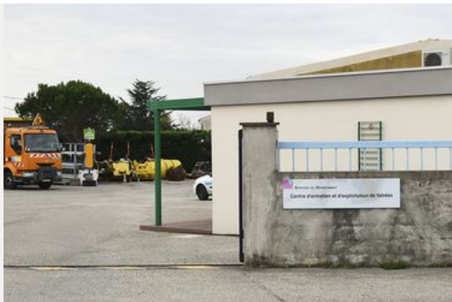
Les agences et centres routiers