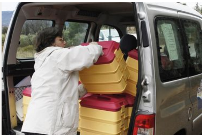
Tout savoir sur l'Allocation Personnalisée d'Autonomie (APA)