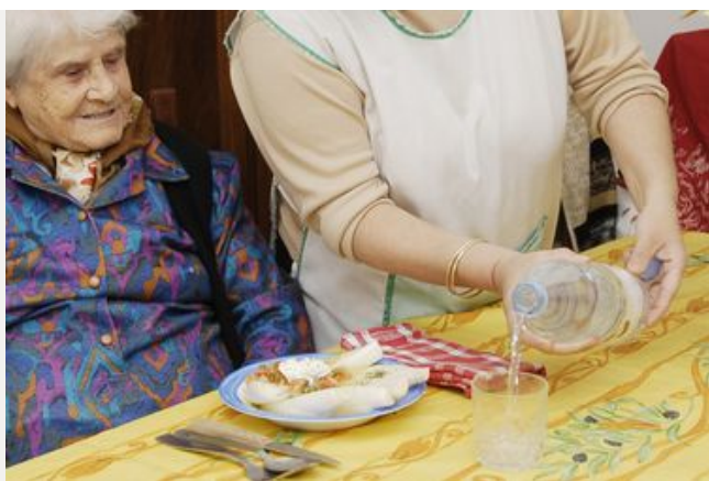
Les aides sociales à domicile