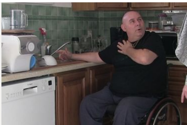
Adapter le logement pour rester à son domicile