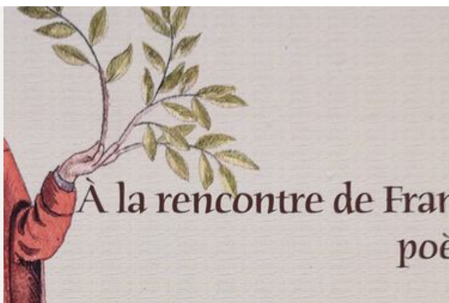
Éditions et publications départementales