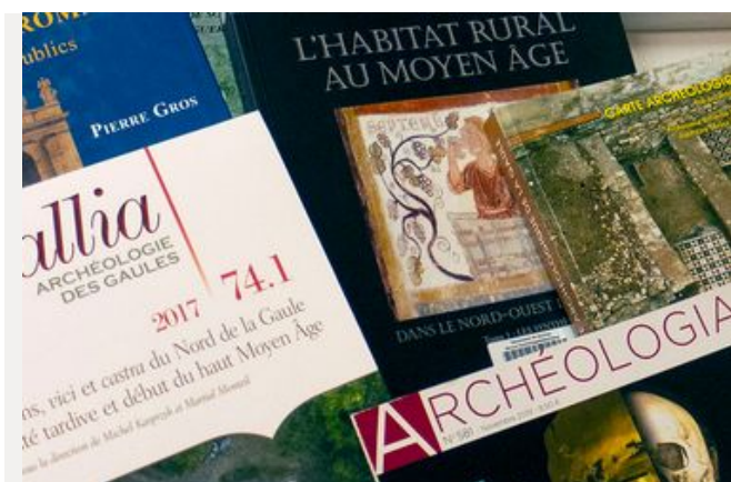
La bibliothèque du service archéologie