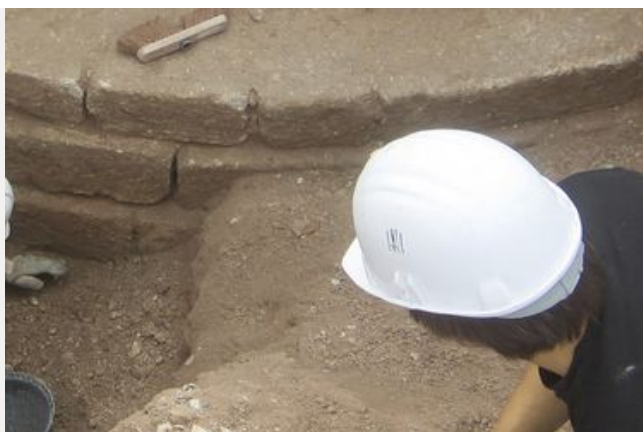
Une expertise archéologique