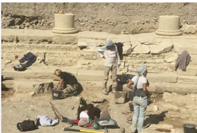
Les visites des chantiers de fouille archéologique