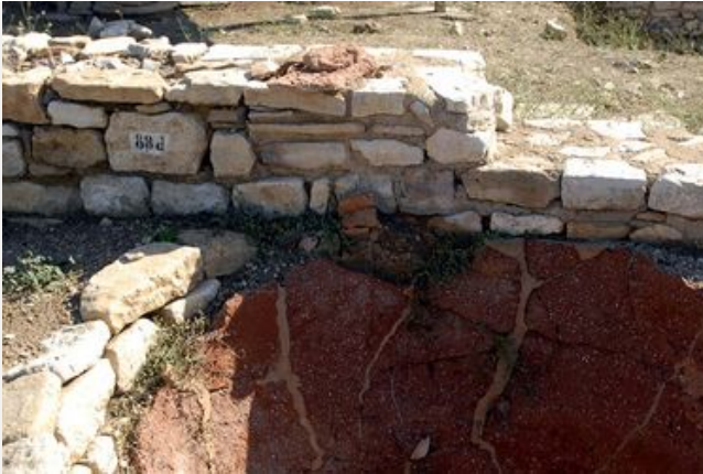
Le service d'Archéologie du Département de Vaucluse

Berceau des sociétés préhistoriques, terre d'échanges entre Celtes et Grecs, le Vaucluse compte six villes romaines, ainsi que de nombreux monuments médiévaux exceptionnellement bien conservés. Tout au long de l'année, des fouilles archéologiques permettent de découvrir, comprendre et documenter l'histoire de notre territoire.