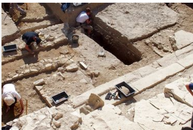
Les dernières découvertes