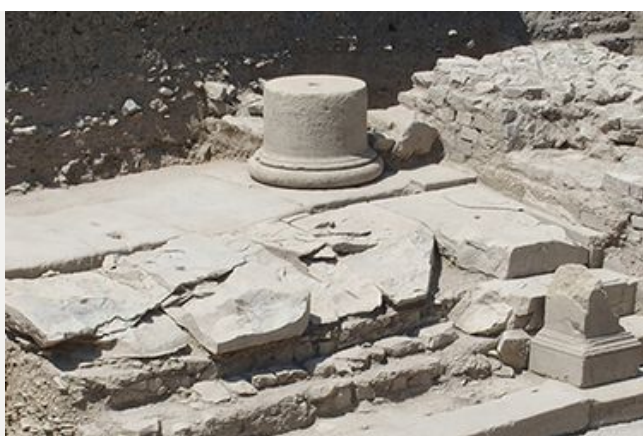
Quelques sites archéologiques