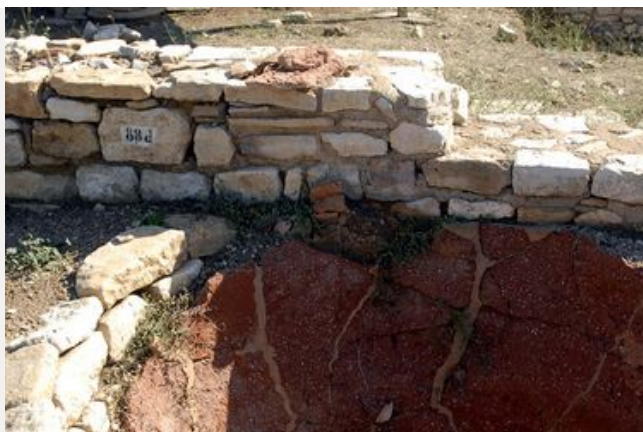
Le service d'Archéologie du Département de Vaucluse

Berceau des sociétés préhistoriques, terre d'échanges entre Celtes et Grecs, le Vaucluse compte six villes romaines, ainsi que de nombreux monuments médiévaux exceptionnellement bien conservés. Tout au long de l'année, des fouilles archéologiques permettent de découvrir, comprendre et documenter l'histoire de notre territoire.