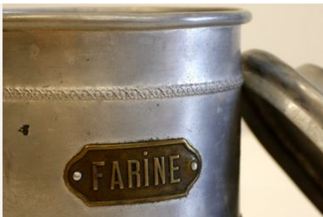
Le Musée de la Boulangerie à BONNIEUX