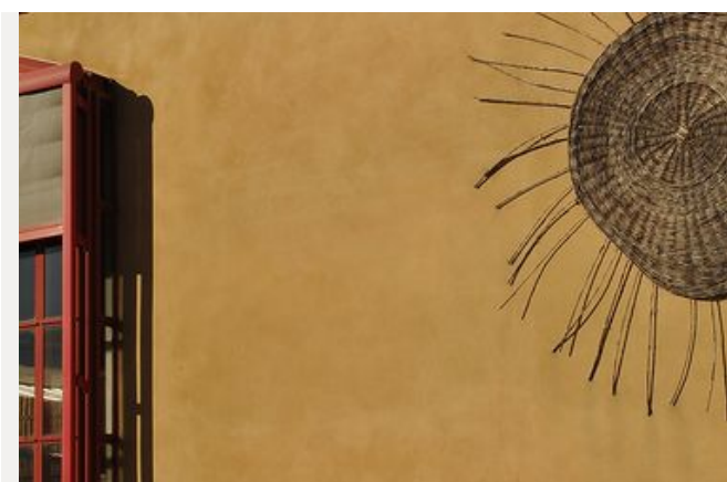
Le Musée de la Vannerie à CADENET