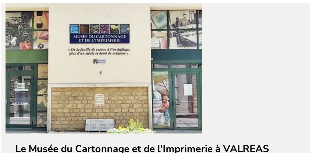
Le Musée du Cartonnage et de l'Imprimerie à VALREAS