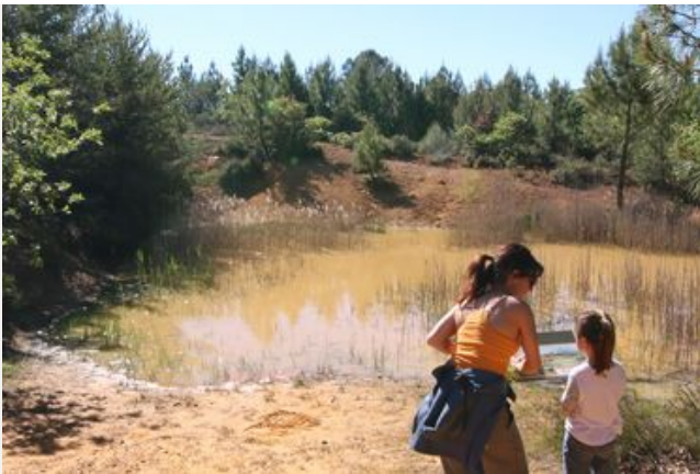
Les actions du Conseil départemental en faveur des Espaces Naturels Sensibles et de la biodiversité

Riche de ses contrastes, le Vaucluse mérite que l'on déploie une politique en faveur de ses espaces naturels. La conservation et la bonne gestion des milieux naturels du département de Vaucluse sont garantes du maintien de la biodiversité.