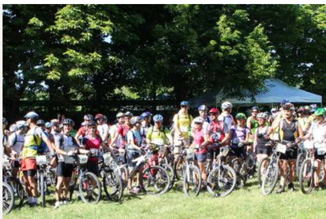
Concertation et développement maîtrisé des sports de pleine nature

La promotion et le développement maîtrisé des Activités de Pleine Nature (APN) ou du « sport de nature » écoresponsable est une compétence pleine du Conseil départemental. Cela recoupe des enjeux sociaux, économiques, environnementaux, et d'autres très spécifiques sur les impacts écologiques, les risques liés aux incendies, et les usages notamment. Les APN sont un levier essentiel du développement de la qualité de vie, du mieux vivre, et de l'attractivité du territoire.