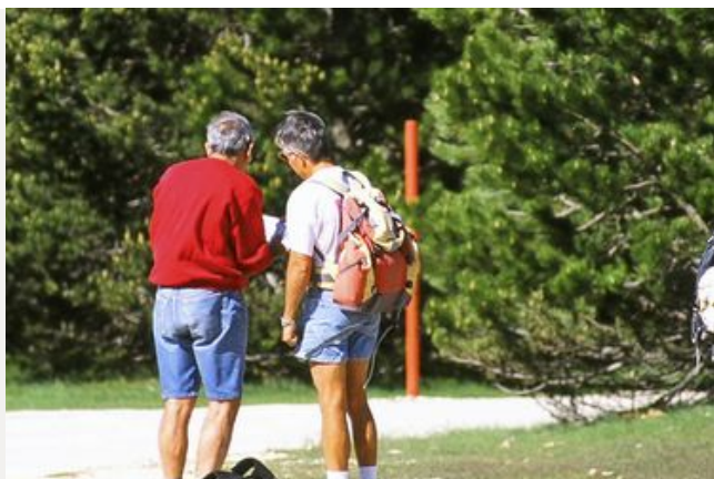
Les sentiers et circuits de randonnée