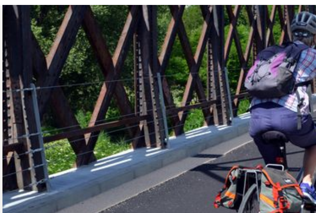
La Via Venaissia