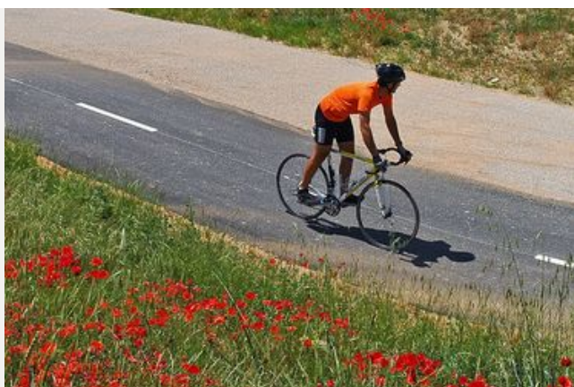
La Véloroute du Calavon - Eurovélo 8

› Les itinéraires vélo en Vaucluse < https://www.prove-a-velo.fr/ >