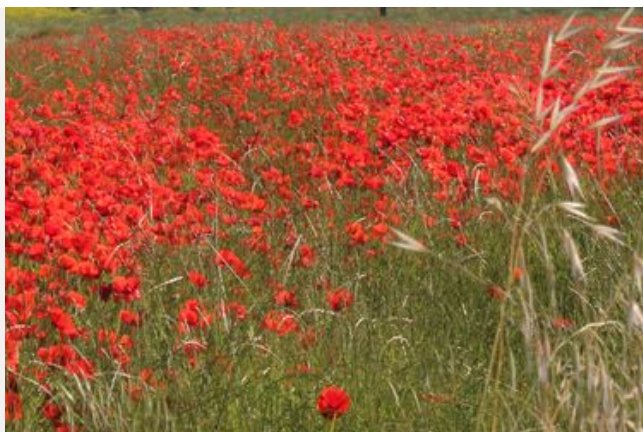
Parcourir le réseau routier départemental du Vaucluse

Le Conseil départemental consacre chaque année entre 11 et 13 Millions d'euros pour assurer l'entretien de ses chaussées, indispensable au maintien en bon état de son réseau routier. Environ 130 km sont renouvelés chaque année, la moitié en enrobés classiques, l'autre moitié en enduits superficiels.