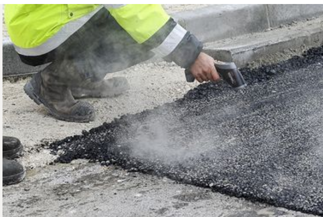
Les techniques d'interventions