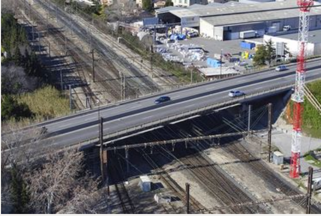
Pont de Fontcouverte sur voies ferrées-Avignon 2016