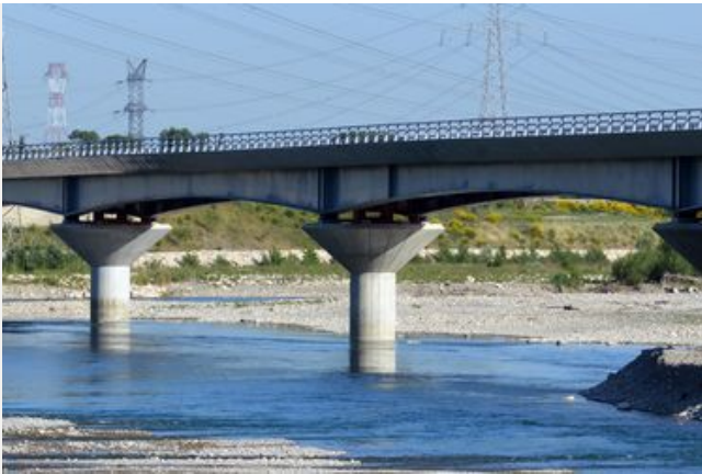
Le pont du Luberon à Cavillon - 2013/2015