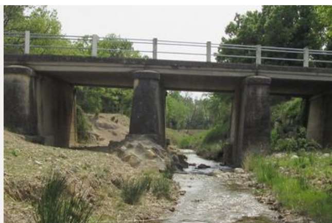
Travaux RD 55 Pont sur la Salette à Aubignan