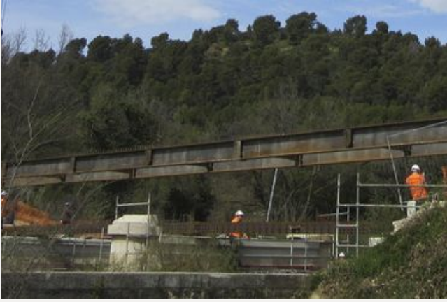
Pont sur le Mardéric-Villelaure et Cadenet 2019