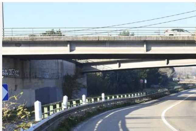
Travaux sur le pont sur le canal de Crillon à Bonpas (RD 907)