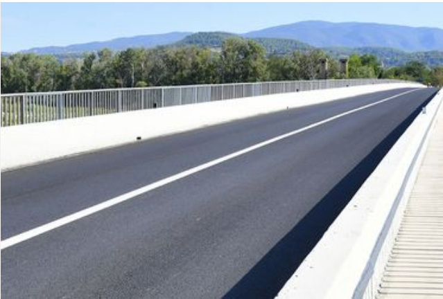
Pont sur la Durance-Cadenet- 2018