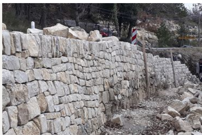
Réparation d'un mur de soutènement en pierres sèches à Saint Martin de Castillon (RD 48)