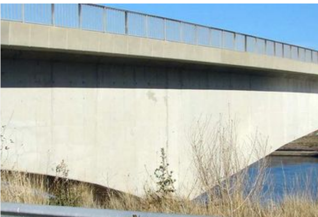
Pont du Tricastin à Bollène 2016