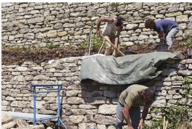
La préservation du patrimoine « pierres sèches »