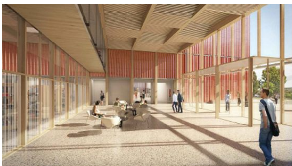
Vue intérieure depuis le hall

Cette équipe de conception comprend de nombreux bureaux d'études pluridisciplinaires et une Architecte associée Anne LEVY, Architecture Design Urbanisme.