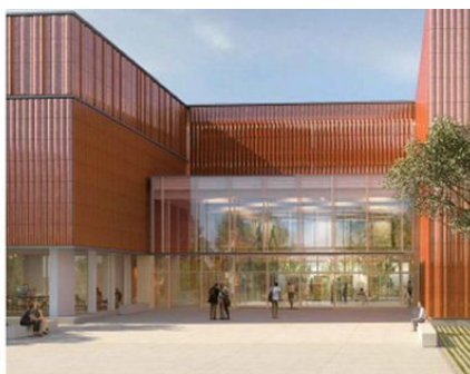
Vue du hall depuis le parvis