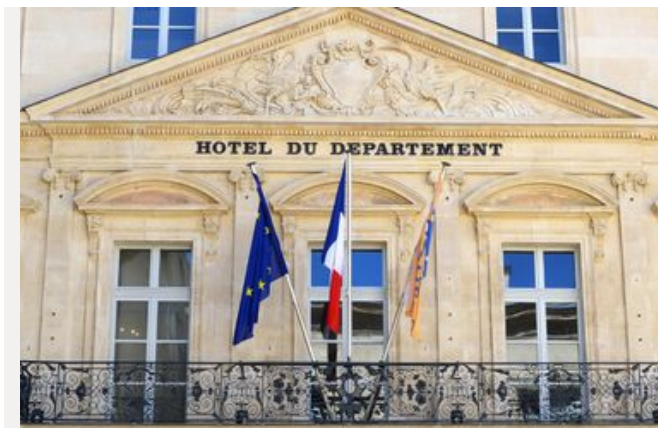
L'organisation des services du Conseil départemental de Vaucluse